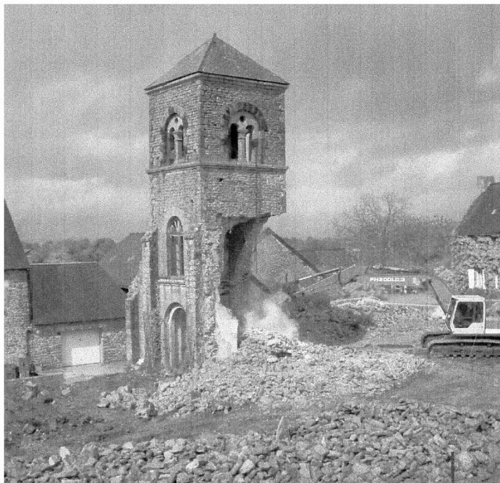
Démolition du clocher le 23 avril 2003

En septembre 2001, une première phase de démolition met à terre la nef, le chœur et les chapelles, le clocher est en sursis. Pourrait-il être conservé ? Si historiquement et architecturalement ce n'était pas la partie la plus intéressante de l'édifice, il n'en reste pas moins son identité, celle qui permet de situer l'ancien bourg puisque, depuis 1994, la nouvelle route évite le village. Un bourg sans clocher est une agglomération sans âme.