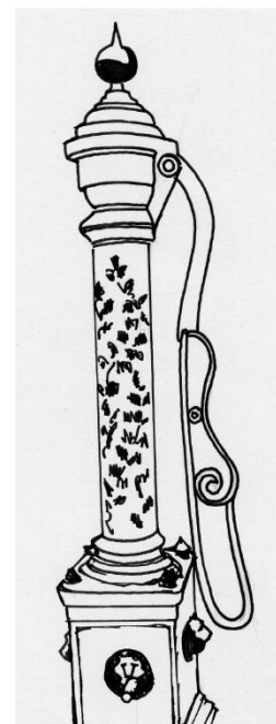
La pompe du puits communal au centre du bourg

Un demi-siècle plus tard, le SIEAP 7 dont le siège est à la mairie de Grazay assure la distribution de l'eau potable dans la commune ainsi que dans les communes de Marcillé-la-Ville et Jublains. L'eau provient du captage d'eau souterraine à la Bousselière (utilisé déjà il y a 2000 ans par les Romains) et de l'eau de la Mayenne traitée par l'usine des eaux de Saint-Fraimbault-de-Prières.