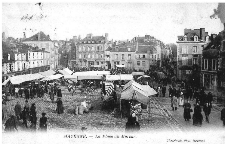
MAYENNE. — La Place du Marché.

Ce lieu a changé plusieurs fois d'aspect.