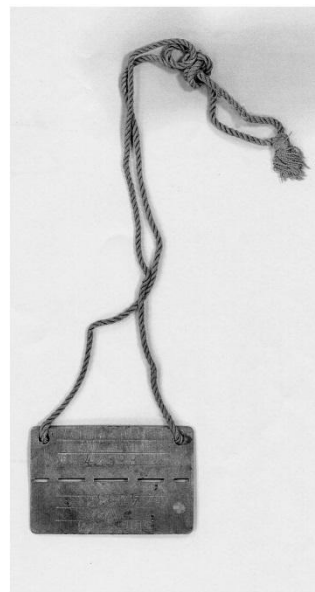
Plaque d'immatriculation métallique

Après la tondeuse sur la tête et sur les joues pour raser une barbe de trois semaines, chacun reçoit une plaque métallique gravée d'un numéro matricule, que les prisonniers devront toujours porter. Jean sera désormais : le n° 42 938.