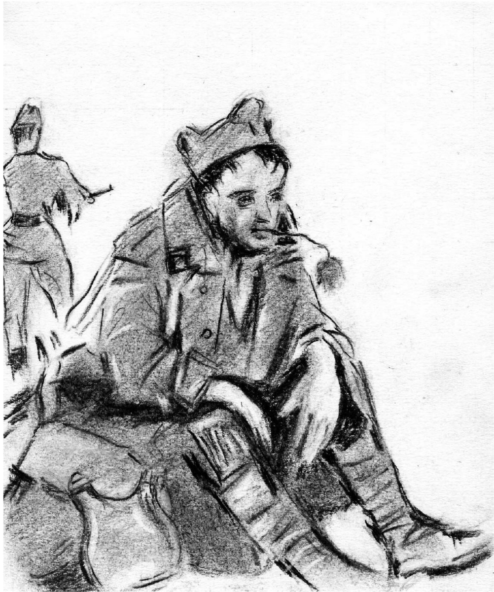
Le prisonnier, dessin de Jean Boccacino