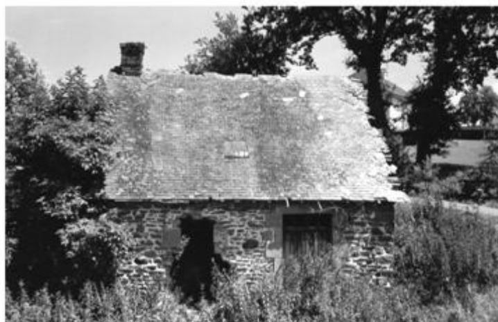
Le lavoir de la Tête rouge

C'est face à la ferme que fut édifée en 1932, la première « cité du Pommier ».