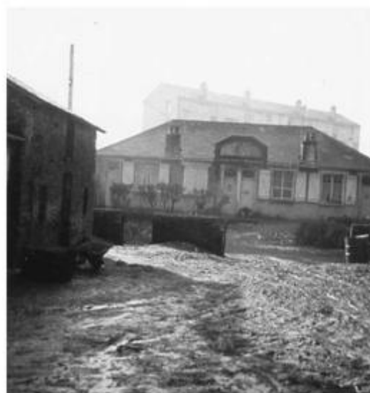
La cité du Pommier

Le confort est minimum, le point d'eau commun est à l'extérieur, au bord du chemin, les commodités et la cave, au fond du jardin, mais les maisons neuves et saines apportent aux locataires, une réponse satisfaisante à l'insalubrité de leur situation précédente. Quatre logements que se partagent trois familles, la plus nombreuse bénéficie de quatre pièces.